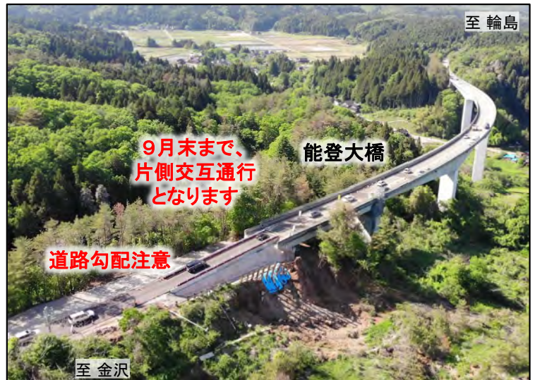
あなみず こし はら のと おおはし 穴水IC～越の原IC間 (能登大橋付近)