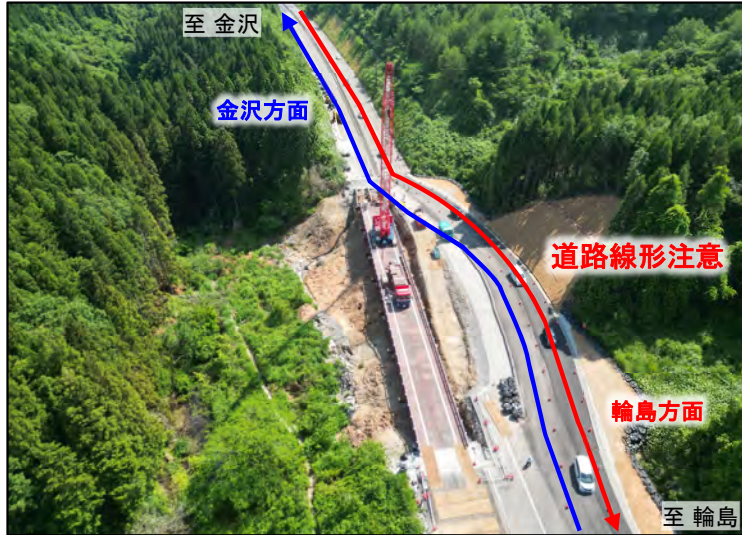
さとやまくこう あなみず のと里山空港IC～穴水IC間 (穴水町北七海地先)

7月17日（水）に 対面通行 とする予定ですが、 土砂崩落箇所等を迂回するため に道路線形や道路勾配が部分的に悪い箇所があります。 通行にあたっては、十分にご注意ください。