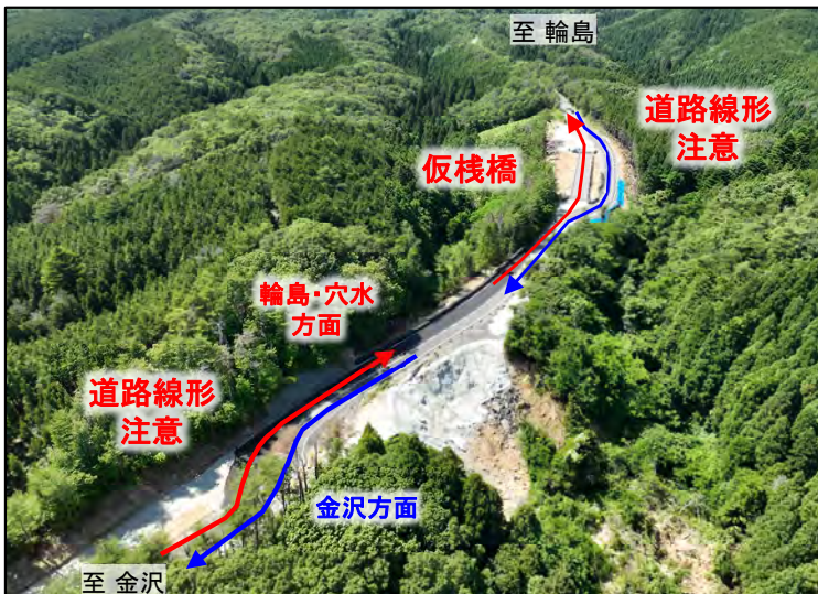
こし はら よこ た 越の原IC～横田IC間 (七尾市中島町小牧地先)