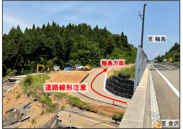
あなみず 穴水IC (オンランプを応急復旧)