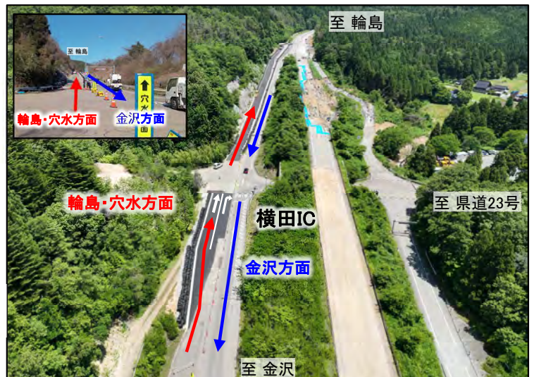
よこた 横田IC (ランプ部を活用した対面通行)