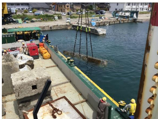
飯田港における啓開作業 (防波堤コンクリート撤去) <5月23日撮影>