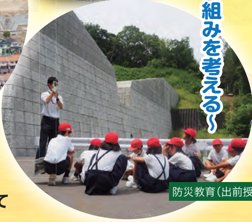
防災教育(出前授業)

繰り返される土砂災害との闘い 土砂災害の歴史や社会情勢の変化を踏まえた今後の取り組みを考える