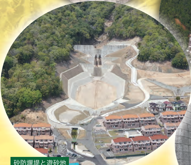
砂防堰堤と遊砂地