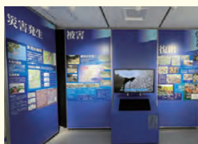
広島市豪雨災害伝承館