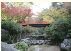
紅葉谷川庭園砂防施設