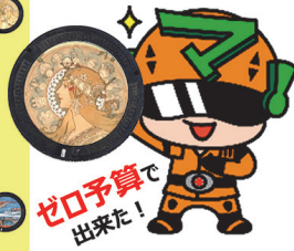
PRキャラクター マモルダラー