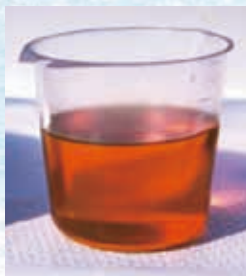
新品のエンジンオイル