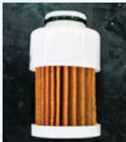
新品の燃料フィルタ