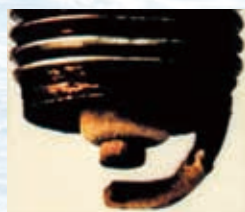
劣化したスパークプラグ