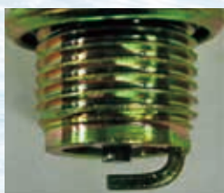
新品のスパークプラグ