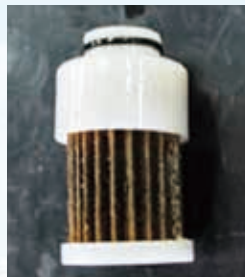
劣化した燃料フィルタ