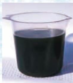
劣化したエンジンオイル