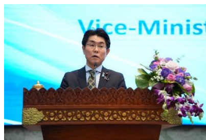
石橋政務官による挨拶