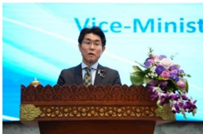
石橋政務官による挨拶