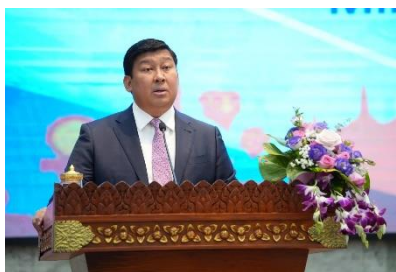
サイ・サムオル副首相による挨拶