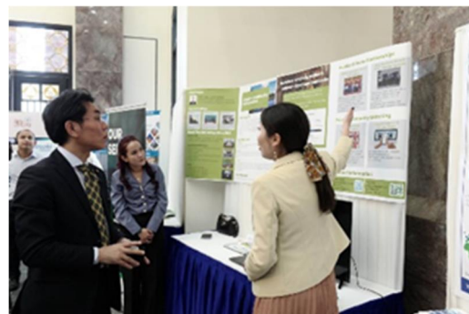
ビジネスマッチング会場視察の様子