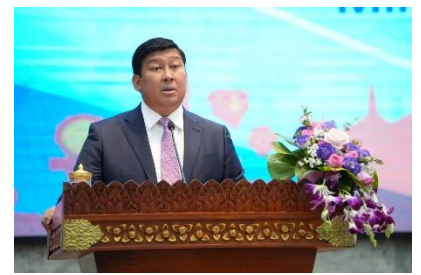
サイ・サムオル副首相による挨拶