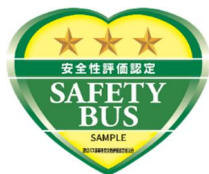
(現行の評価認定マーク)