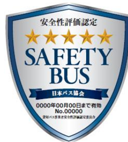
(新評価認定マーク)