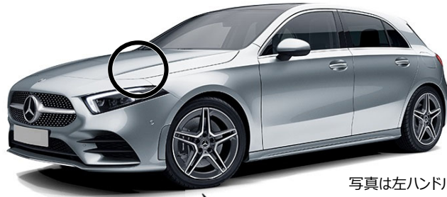
写真は左ハンドル仕様車