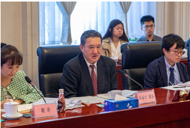
国土交通省 長谷川審議官による開会挨拶