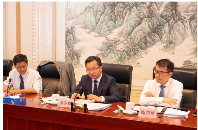
交通部 吳局長による閉会挨拶