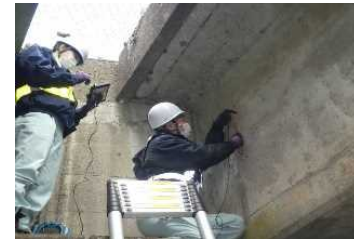
AEセンサを利用した PCグラウト充填把握