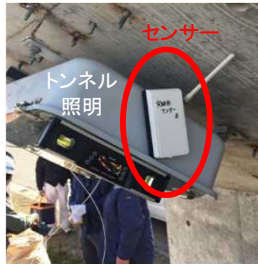
トンネル内附属物の 異常監視センサー