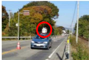
車載装置による路面性状測定