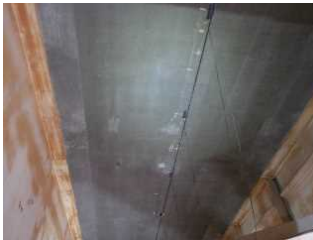
光ファイバーセンサーによる 橋梁モニタリング