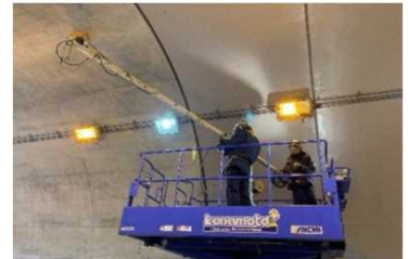
レーダーを利用した トンネル覆工の変状把握