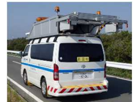
3次元レーザーセンサ を用いた舗装損傷検知