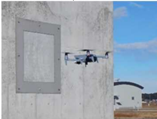
ドローンによる損傷把握