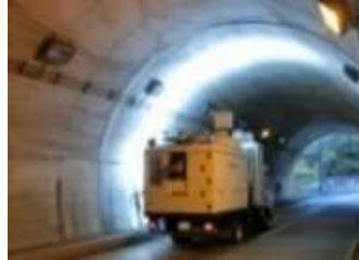
レーザースキャンによる変状把握