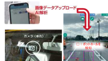
スマートフォンやドライブレコーダー による舗装損傷検知