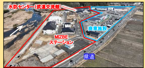
民間商業施設と隣接