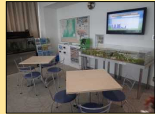
防災啓発コーナー