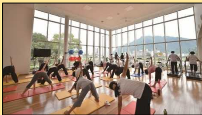
運動・教室スペース(エクササイズ)