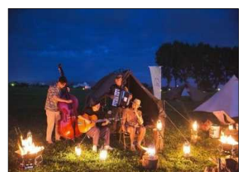
MIZBEステーションを拠点とした各種イベント実施例