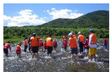
MIZBEステーションを拠点とした自然体験活動例