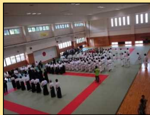
水防センター(武道交流館)