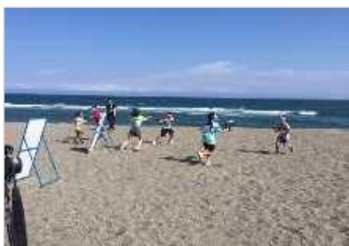
海岸PR活動（水鉄砲大会） [高知県：高知海岸]