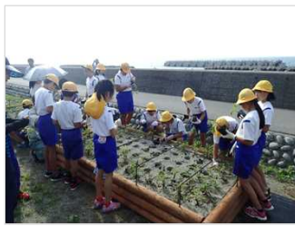
海浜植物の植栽・保護 [富山県：下新川海岸]