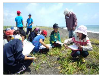
環境教育活動 [北海道：胆振海岸]