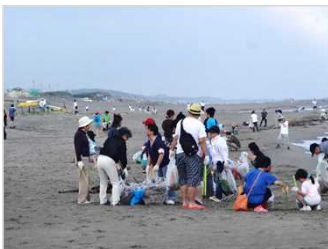
海岸清掃活動 [新潟県：新潟海岸]