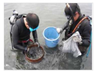
生物育成環境モニタリング [兵庫県：東播海岸]