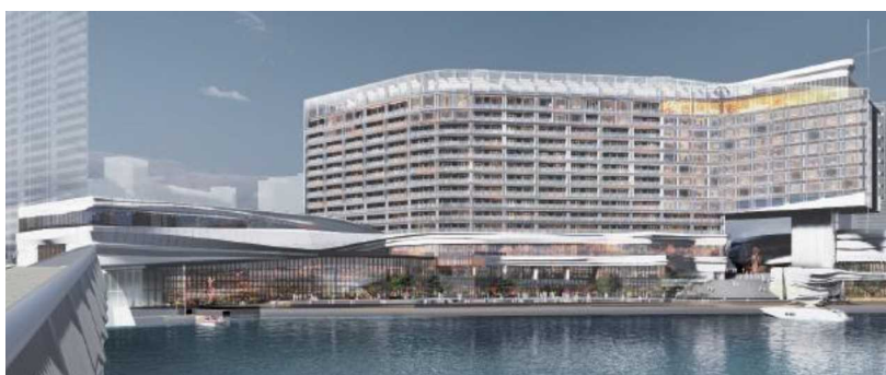
みなとみらい21中央地区62街区 ハーバーエッジプロジェクト完成イメージ