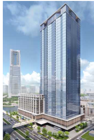
（仮称）北仲通北地区 A1・2 地区完成イメージ