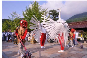
【津和野町】頭屋前（町民センター）で舞う 鶺鴒舞神事