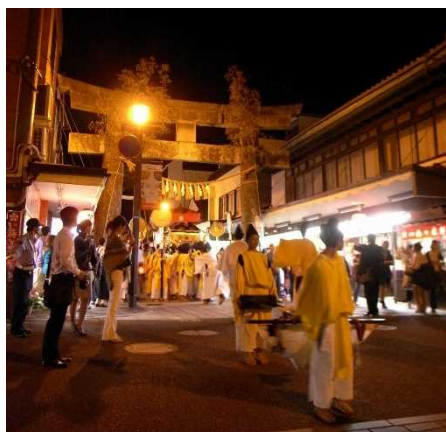
太宰府天満宮参道を通る 神幸式の行列 しんこうしき

第2期計画では、引き続き、歴史的建造物の保存修理やその他の建造物の修景のほか「さいふまいり」の名所地や散策路、文化遺産周辺の環境整備を推進することで、各エリアの個性や魅力を向上させ、歴史的風致の維持及び向上を図っていきます。このことにより太宰府天満宮参道一極集中となっている来訪者の回遊性をさらに高め、滞在時間の延長に繋がります。