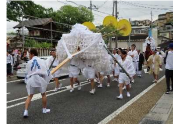
【宇治市】宇治のまちなみと大幣神事