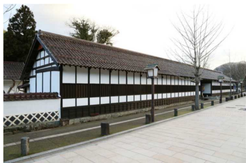
藩校養老館(県史跡)と殿町通り