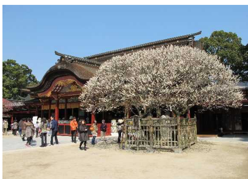
太宰府天満宮本殿(重要文化財)と飛梅 とびうめ