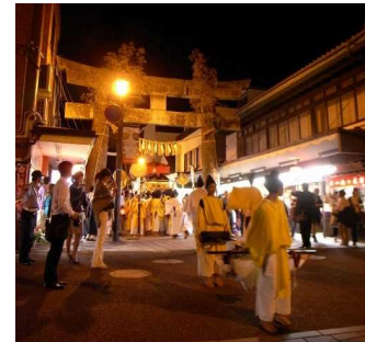
【太宰府市】太宰府天満宮参道を通る 神幸式の行列

今回の認定により、歴史まちづくり計画認定 90 都市のうち、第1期計画を完了し、第2期計画の取組を進める都市は36都市となります。