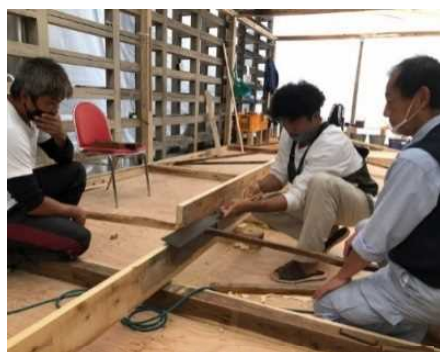
舟大工の育成(鶺鴒舟の造船)

第2期計画では、伝統的な活動の担い手不足などの課題に取り組むほか、第1期計画で進めた整備についても、市民の誇りにつながる本物志向の観光まちづくりに取り組んでいきます。