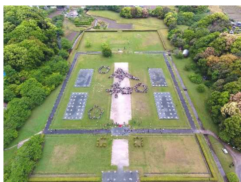
「令和」の人文字プロジェクトが行われた 大宰府跡(特別史跡) ださいふあと