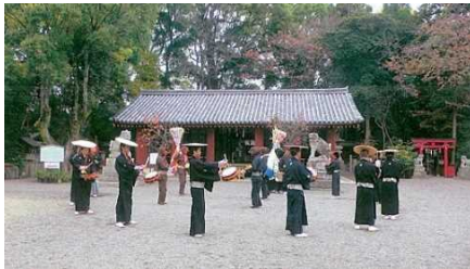
【堺市】桜井神社拝殿（国宝）と 上神谷のごどり