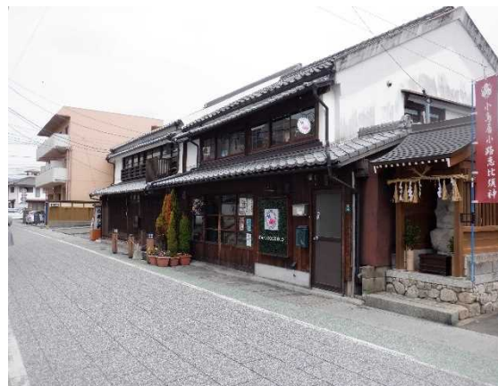
6 小鳥居小路の恵比寿像と 歴史的風致形成建造物 ことりいしやうじ