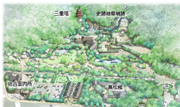
岐阜公園再整備イメージ