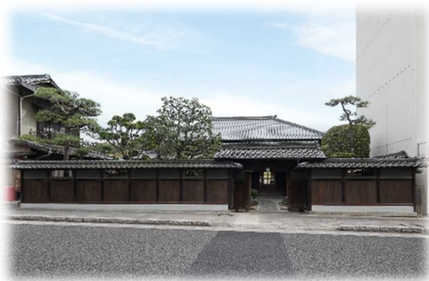
【ファンド支援のイメージ】