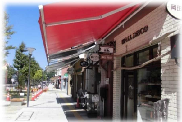
【ファンド支援のイメージ】