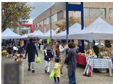
（北海道室蘭市より提供）