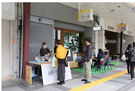
（岐阜県大垣市より提供）