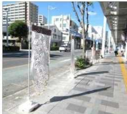
歩道に設置された違反のぼり旗 (是正指導)