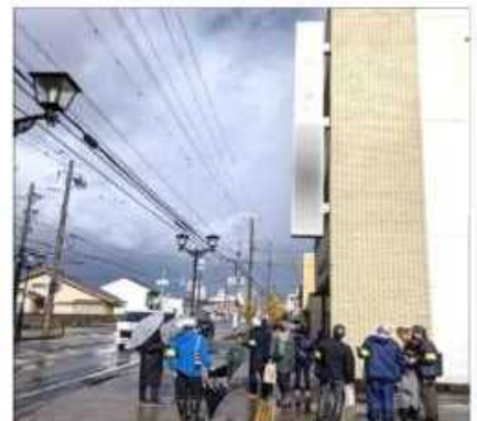
袖看板の安全確認 (安全点検パトロール)

パトロール等へ参加したボランティアの数 …のべ約 2,400 人 是正指導を行った件数 …約 2,820 件 除去したはり紙等 …約 15,000 枚