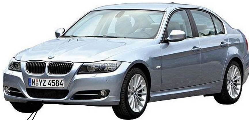
写真は左ハンドル車