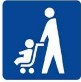
ベビーカーマーク

ベビーカー使用者が安心して利用できる場所や設備（エレベーター、鉄道やバスの車両スペース等）を表しています。