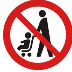
ベビーカー使用禁止マーク

ベビーカー使用者が安心して利用できる場所や設備（エレベーター、鉄道やバスの車両スペース等）を表しています。