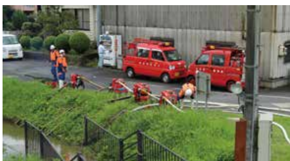
島根県川本町消防団 排水活動を実施 (令和2年7月14日:江の川左岸)