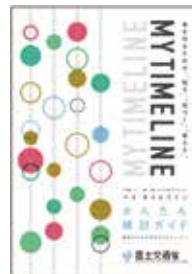
かんたん検討ガイド