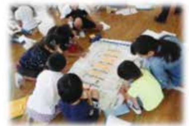
マイ・タイムライン作成・検討の様子