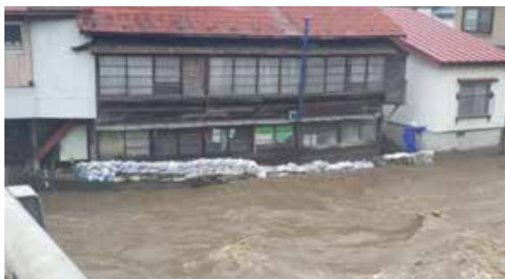
岩手県一戸町消防団 積み土のう工法を実施 (令和2年7月12日～13日:馬淵川左岸)

令和2年7月豪雨など、梅雨前線や台風に伴う豪雨により、全国各地で洪水による被害が発生しました。そのような状況の中、水防団は、堤防からの越水対策として「積み土のう工法」、漏水対策として「釜段工法」などを実施し、人命の安全確保や被害の軽減に大きく貢献しました。