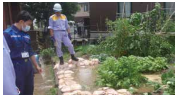
岐阜県岐阜市本荘水防団 釜段工法を実施 (令和2年7月8日:長良川左岸)