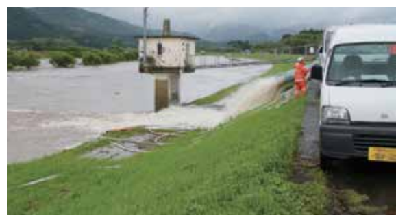
鹿児島県湧水町消防団 排水活動を実施 (令和2年7月6日:川内川左岸)