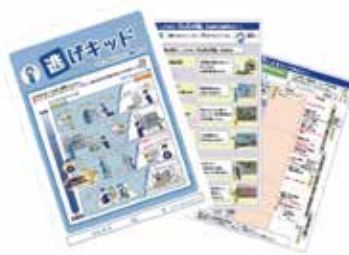
検討ツール「逃げキッド」

マイ・タイムラインの検討は、洪水ハザードマップ等を用いて居住地などの自ら関係する水害リスクや入手する防災情報を 知る ところから始まり、避難行動に向けた課題に 気づく ことを促し、どのように行動するか 考える 場面を創出することが重要です。