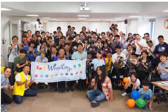
全国での街歩き体験の様子(2019年小田原にて)

WheeLog!を活用して、車いすユーザーと健常者が一緒に街へ出かける「街歩き体験」のイベントを全国各地で開催。このイベントを通じ、バリアフリー情報を投稿するにあたって、バリアフリーに関する様々な課題について解決策を自ら考えるという当事者意識を醸成するとともに、自分たちが暮らす地域の問題点についても考えるなど、心のバリアフリーを通じた地域活性化に貢献。