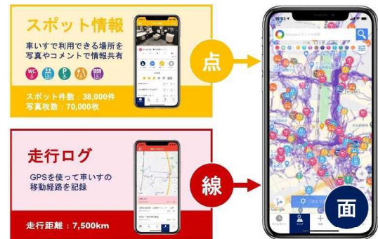
「ユーザー投稿型」の新しいバリアフリーマップのプラットフォーム