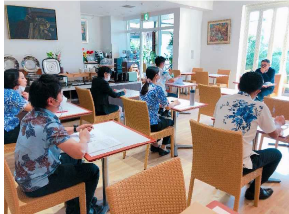
定期的に行われるLGBTマナー研修の様子