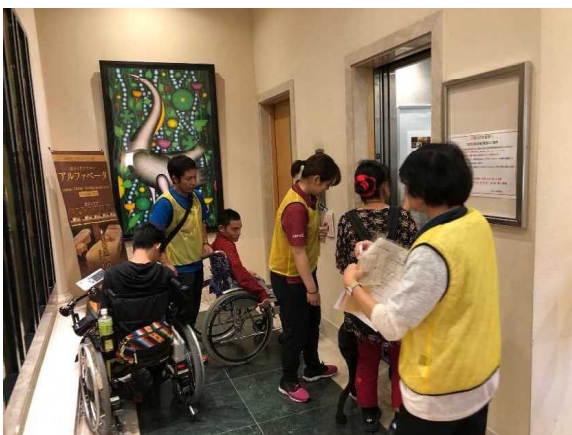
全国初の夜間営業中での 消防訓練にのぞむ参加者

ホテル営業中の『夜間』にて言葉の通じない外国人やけがをした宿泊客、聴覚、視覚障害、車いすの肢体不自由の方(実際に障害当事者の方が参加)を対象とした夜間消防訓練を全国で初めて実施し、日々の防災危機管理徹底を目的とした様々な障害のある方を安心して滞在できる観光地形成に寄与。