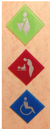
バリアフリートイレとピクトグラム