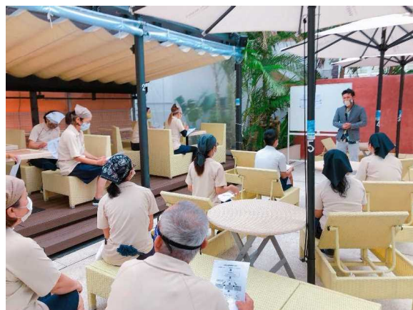
総支配人によるクリーンスタッフ への防災危機管理研修の様子