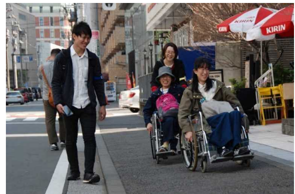
街歩きを通じた心のバリアフリーの醸成