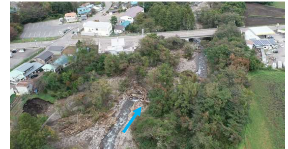
土砂・流木の堆積状況(湯尻川)