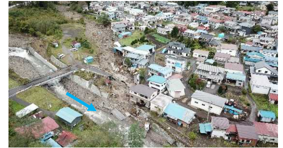
嬭恋村田代地区の被災状況(吾妻川)