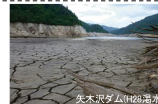
矢木沢ダム(H28渇水)

将来、気候変動により、無降水日数の増加や積雪量の減少等による渇水被害が増加することが予測されており、渇水被害が頻発・長期化・深刻化することが懸念