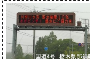
国道4号 栃木県那須町