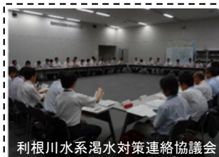
利根川水系渇水対策連絡協議会

水利用の適正かつ円滑な調整を実施(国土交通省、関係6都県等の関係機関により構成)