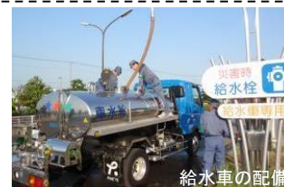
給水車の配備

給水用資機材の配備や人員、計画等の各種体制を整備し、断水が生じた地域に出動できる体制を確保