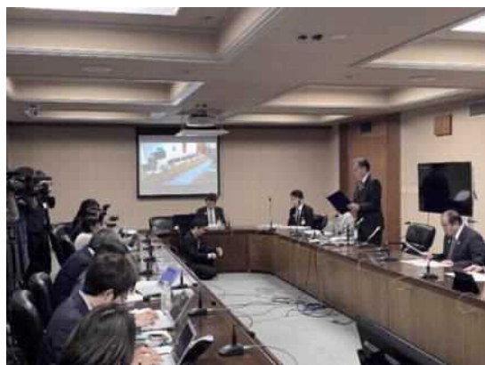
【気候非常事態宣言と知事による発表会見の様子】