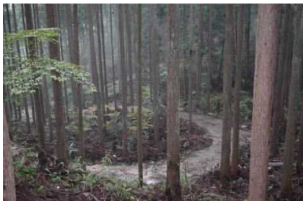
【林道・森林作業道の整備】