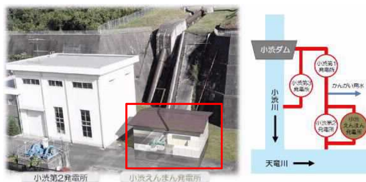
【小水力発電所イメージ(例：小渋えんまん発電所)】