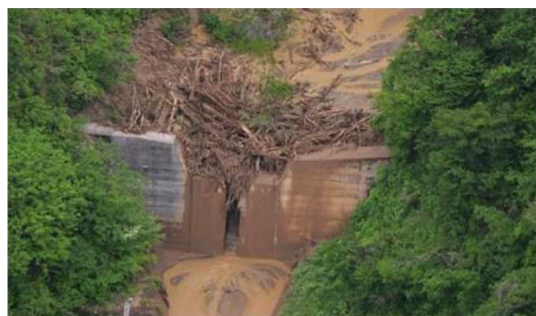
【砂防施設の土石流・流木捕捉事例】