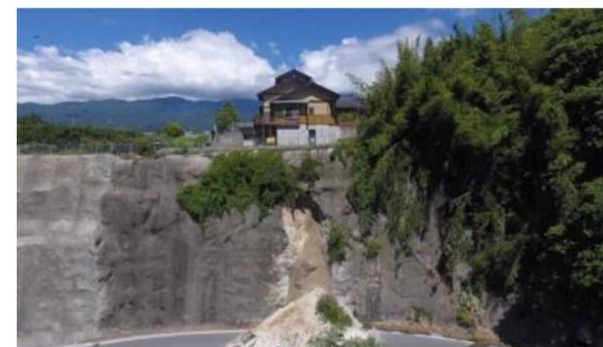
【道路法面整備イメージ】