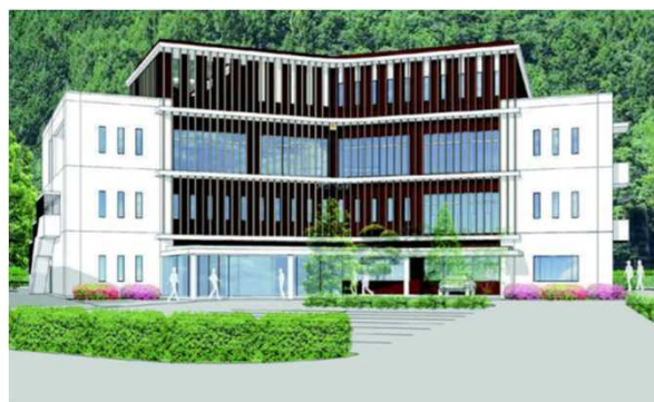
【例：木曽警察署 建設イメージ】