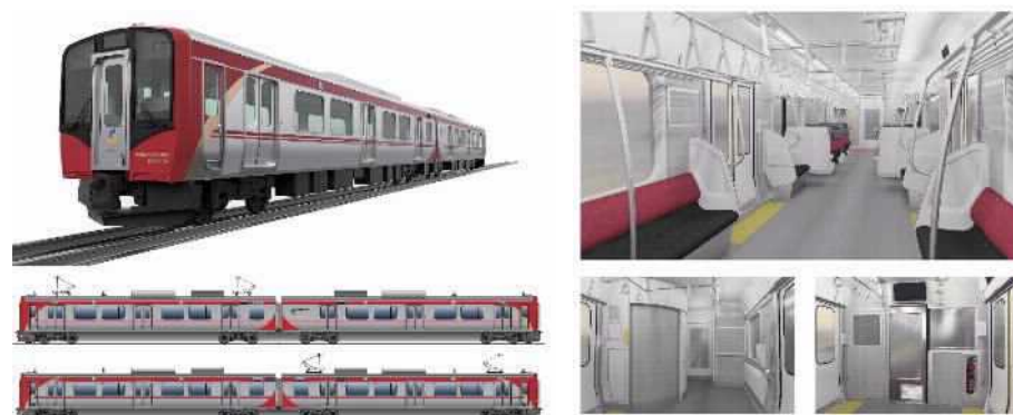
【新型鉄道車両 SR1系イメージ】