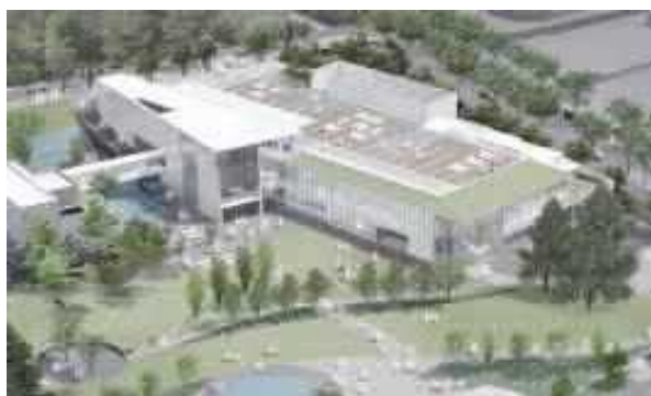
【例：長野県立美術館 改築後イメージ】