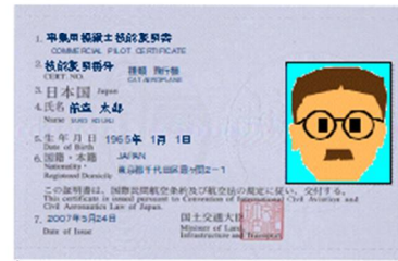
技能証明書(ライセンス)