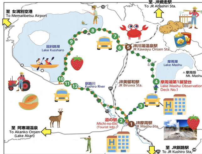
弟子屈町内 1日貸切観光タクシー