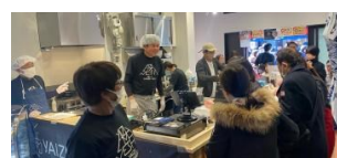
▲テストマーケティングの様子

※2023年12月～2024年2月に実証実施し、現在継続して販売中 (2024年7月現在)