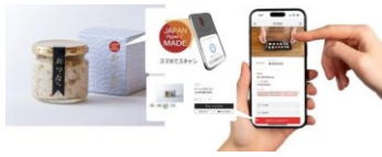
▲スマートフォンによる情報提供