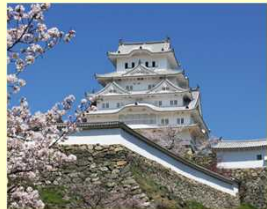
姫路城世界遺産登録30周年 天守等の限定公開 (兵庫県) 2023年