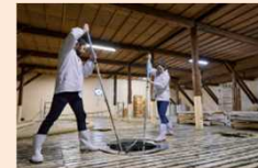
世界遺産登録を目指す 「伝統的酒造り」 2024年