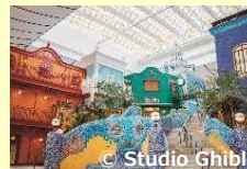
ジブリパーク開業 (愛知県) 2022年11月