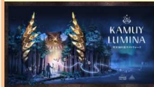
阿寒摩周国立公園での 夜間イベント (北海道) 2022年