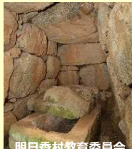
明日香村教育委員会 都塚古墳の内部公開 (奈良県) 2022年