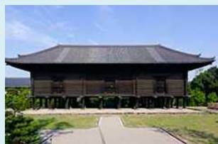
正倉院関連イベント (奈良県) 2025年