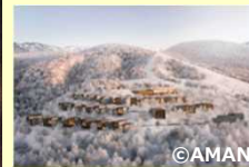
高級ホテルの開業予定 スノーリゾートに ニセコ町 (北海道) おけるゴンドラ増設 (長野県) 2023/2024年