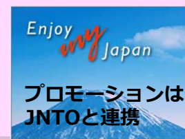
プロモーションは JNTOと連携