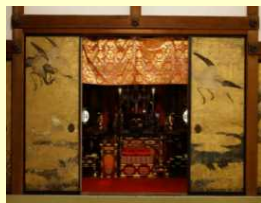
弘法大師生誕1250年 座像の限定公開 (和歌山県) 2023年