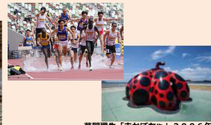
草間彌生「赤かぼちゃ」2006年 直島・宮浦港緑地 世界陸上 瀬戸内国際芸術祭 2025年