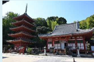
明王院五重塔の内部公開 (広島県) 2024年