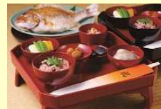
「和食」 世界遺産登録10周年 2023年