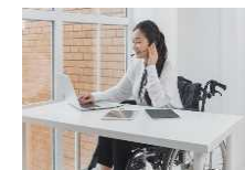
バリアフリーワーケーション スペースの整備