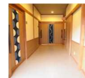
館内通路の段差解消