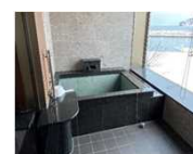
個室浴室のバリアフリー化