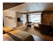
バリアフリー客室の整備