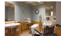
客室トイレのバリアフリー化