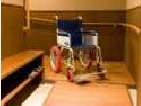
① 出入口の段差解消