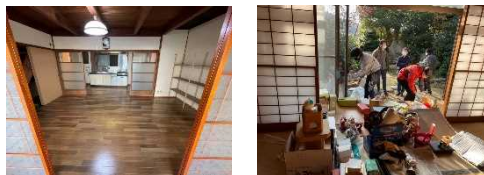
清掃イベントとして居住者や地域の方と一緒に清掃