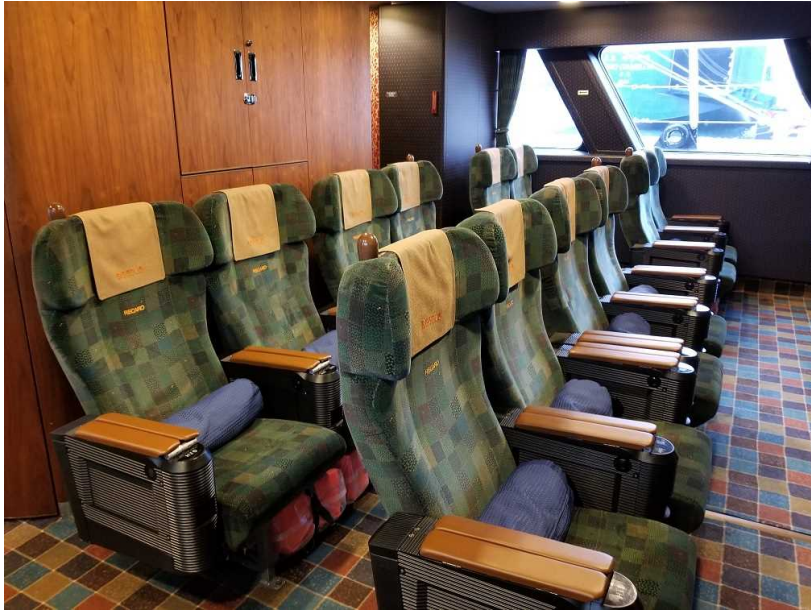
○グリーン席肘掛 (緩衝材付きに交換)