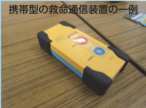
携帯型の救命通信装置の一例

退船時には、レーダートランスポンダとEPIRBを持ち出しましょう！ 携帯型の救命通信装置の備え付けも有効です！