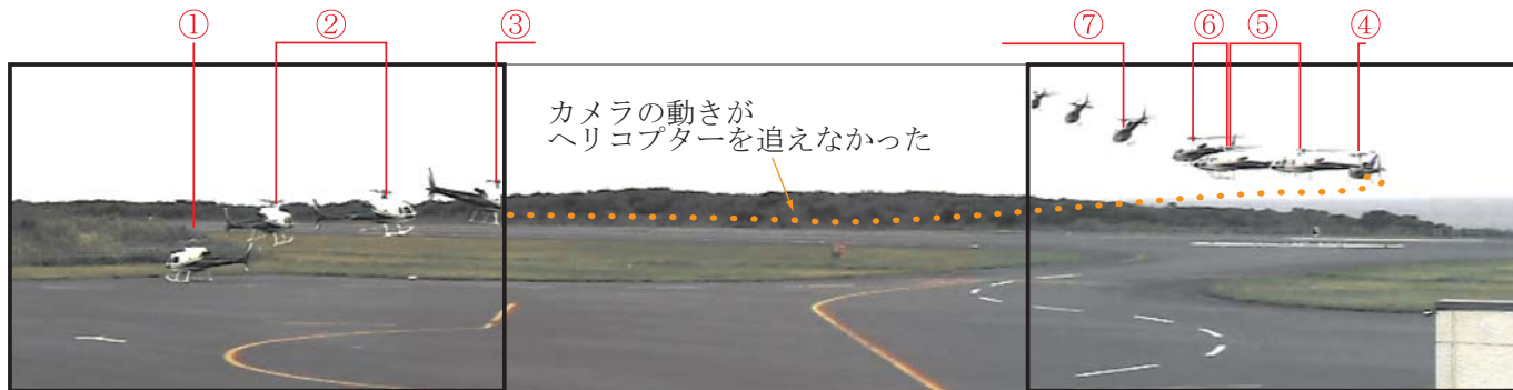
最初の I T V映像範囲