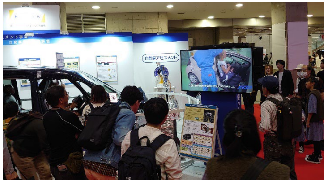
一般来場者の様子