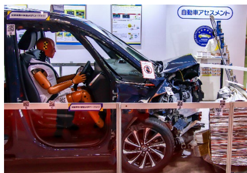
二次元コードによる解説サイトへの誘致