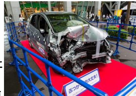
衝突試験車両の展示