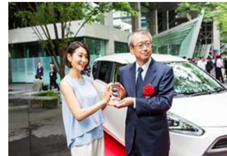
真鍋かをりさんからトロフィーの贈呈