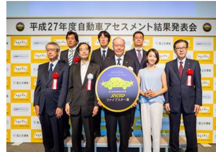
受賞者等による記念撮影