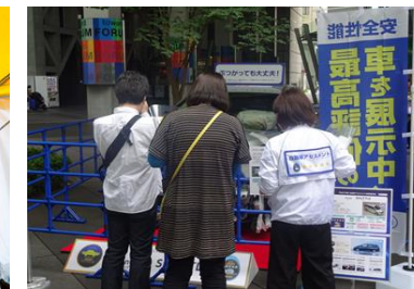
職員によるご案内の様子