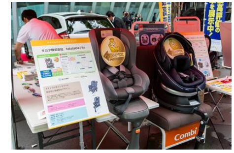
ISO-FIX対応チャイルドシートの展示