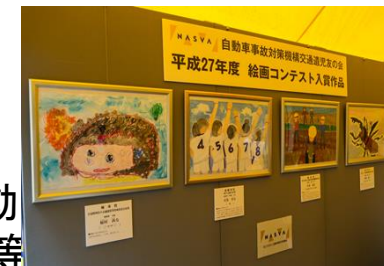
交通事故被害者等作品展示