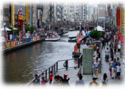
遊歩道の民間活用 (道頓堀川／大阪市)