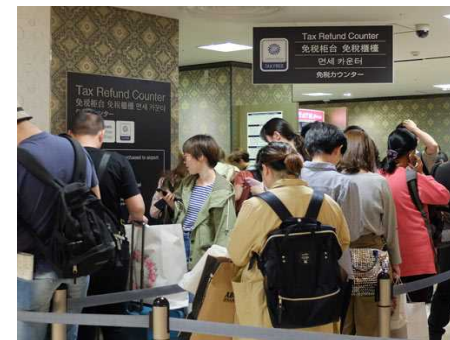
行列となっていた事例