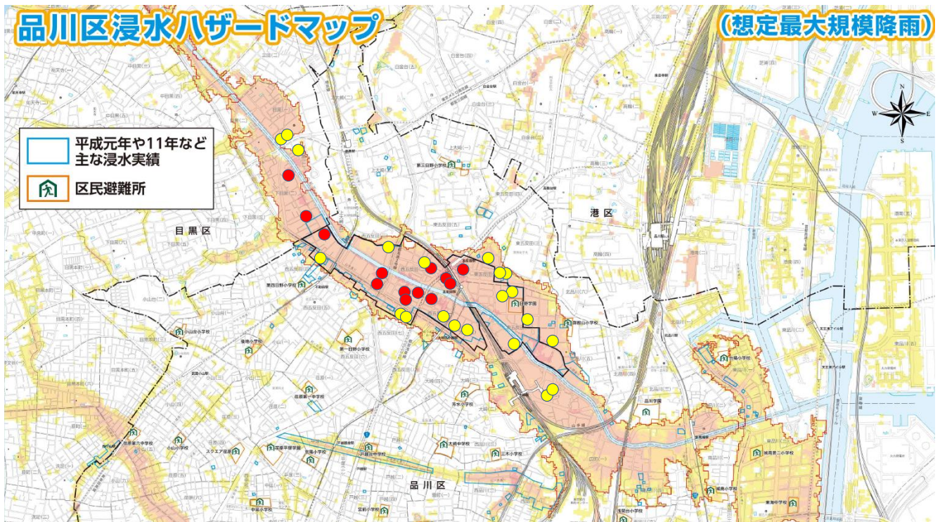
図表 4 浸水深 200cm 以上となる REIT 保有物件の立地状況(品川区・目黒区)

注)図表 5 で示した品川区・目黒区に所在する浸水深 200cm 以上に立地する物件を「品川区浸水ハザードマップ」にプロットした。