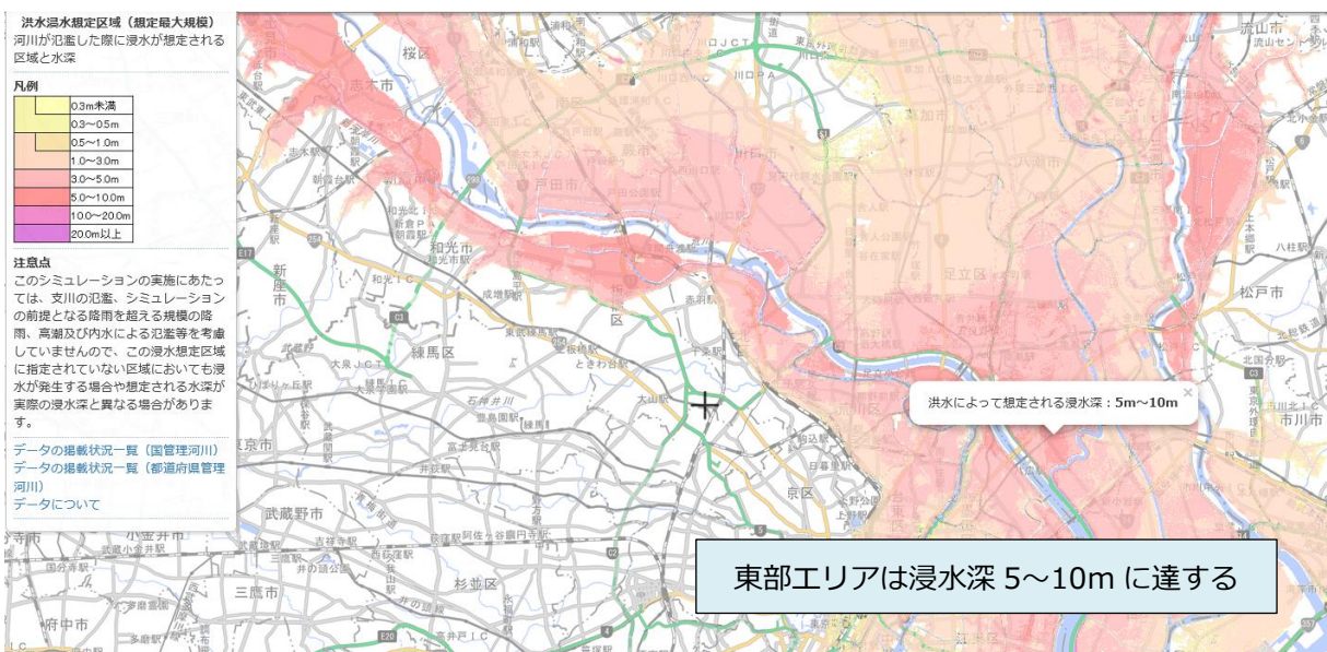
図表 2 東京都東部エリアにおける洪水浸水想定区域指定状況(想定最大規模)

注)ハザードマップポータルサイト「重ねるハザードマップ」にて「洪水浸水想定区域(想定最大規模)」を表示