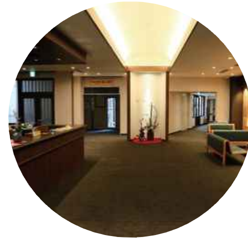
市のすべての 宿泊施設の収容人数