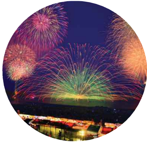
熊野大花火大会来場者