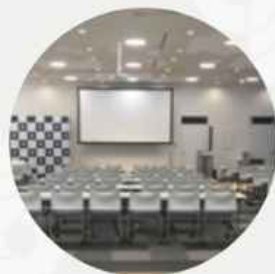
会議室・ セミナー会場