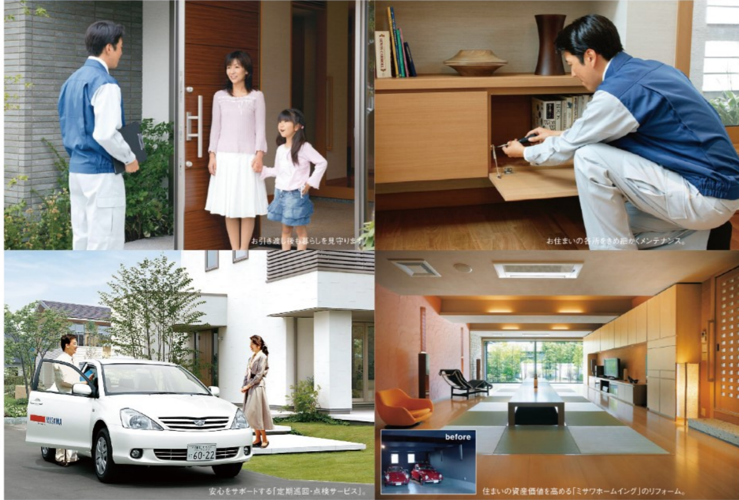
お引渡し後も暮らしを見守ります。

住まいを通じて生涯のおつきあい。 ミサワホームは先々まで、ご家族と住まいを見守ります。