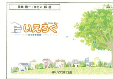
「いえろぐ」の中のメンテナンスプログラムは、計画的なメンテナンスを情報面からサポートします。 ※2009年5月1日以降にご契約の戸建住宅が対象です。

住まいの過去の補修履歴情報は、適切なメンテナンスや部品交換を行うために非常に重要な役割を果たします。積水ハウスでは、独自の住宅履歴情報の蓄積・更新台帳「いえろぐ」を導入し、1邸宅ごとの住まいのデータを保管。そのデータを活用して、補修箇所の確認や必要部材の手配などを迅速かつ的確に行います。また「いえろぐ」は、長期優良住宅認定制度適用住宅に必要なとされる住宅の建築・維持保全記録としてご利用いただけます。