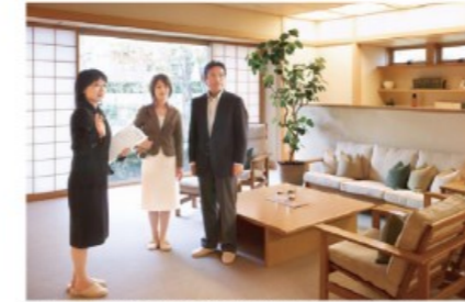
ミサワホームの住宅展示場のデザインを再現できる「ミサワホームイング」

フォーム商品をラインアップ。ミサワホームイングのリフォームシステムは、住まいを定期的にグレードアップしていくという基本コンセプトや、環境に配慮した素材・工法などが評価され、グッドデザイン賞を受賞しています。