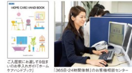
ご入居前にお渡しする住まいのお手入れガイド「ホームケアハンドブック」