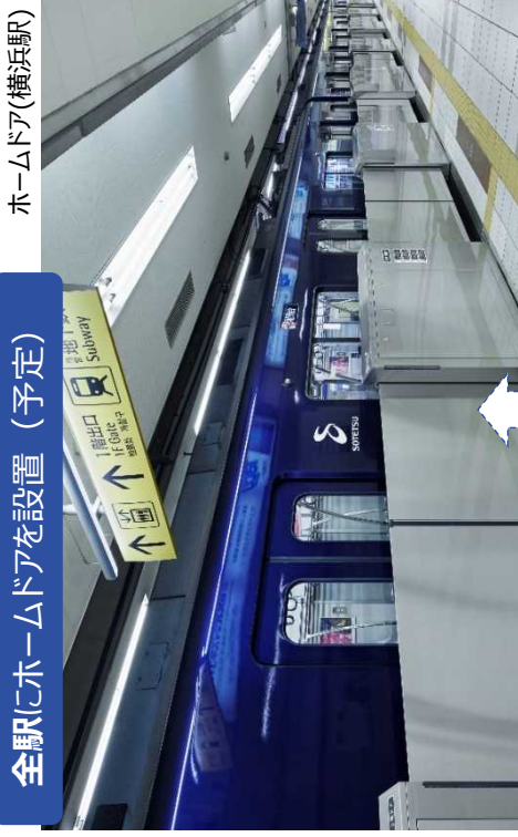
ホームドア(横浜駅)