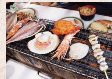
木更津「活き活き亭」の海鮮BBQ

「航海用電子参考図 (new pec)」から転載 (一財)日本水路協会承認 第290105号