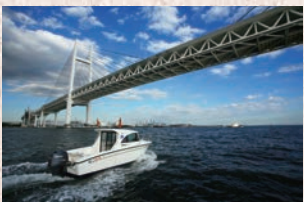
横浜ベイブリッジ