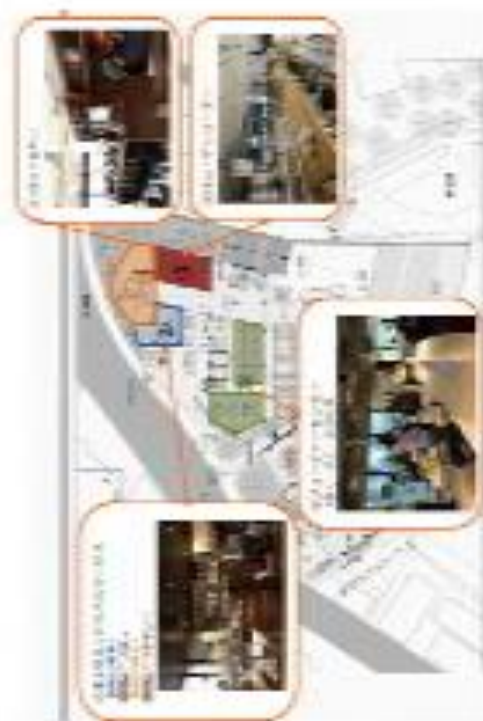
生涯学習施設（1階）/公民館