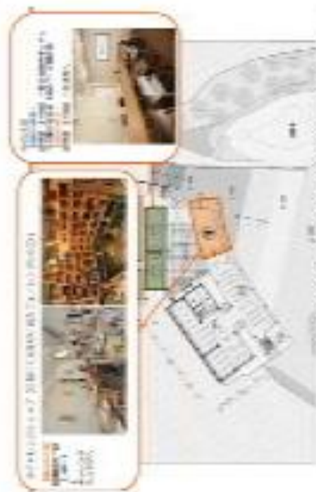
生涯学習施設（地下1階）/公民館