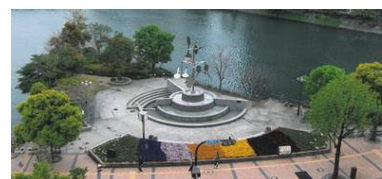
[イベント利用状況]