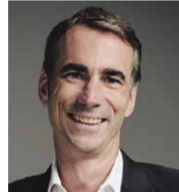
アレクサンダー・シュラウピッツ氏 ルフハンザ ヴァイス・プレジデント・マーケティング