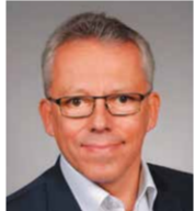
トーマス・キップ氏 DPDHLグループ エグゼクティブ・ヴァイス・プレジデント