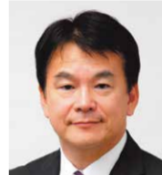
清水 勇人氏 さいたま市長