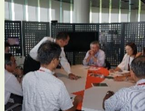
各地の地域によるメンテナンス活動の紹介