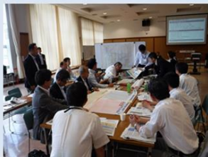
個別施設計画の策定・実施の課題解決につながるアイデア紹介