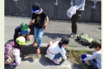
地域一体の取組みへのサポート