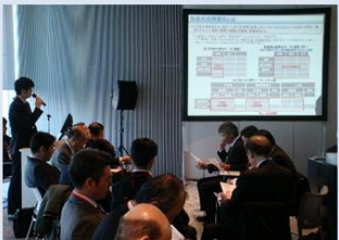
包括的民間委託等の民間活用取組み事例の紹介