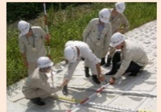
地域における技術者派遣の仕組みづくりの支援