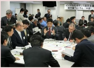
メンテナンスの課題を解決する技術等の紹介や技術マッチング