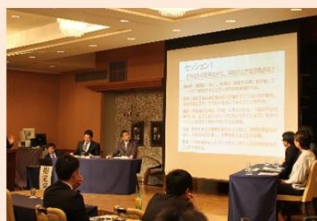
技術者の確保や育成に関する各地での取組み紹介