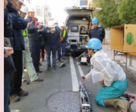
新技術導入の検討の現場試行の調整