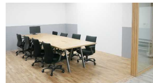
会員専用ミーティングスペース