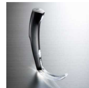
本施設でデザインされた 喉頭鏡