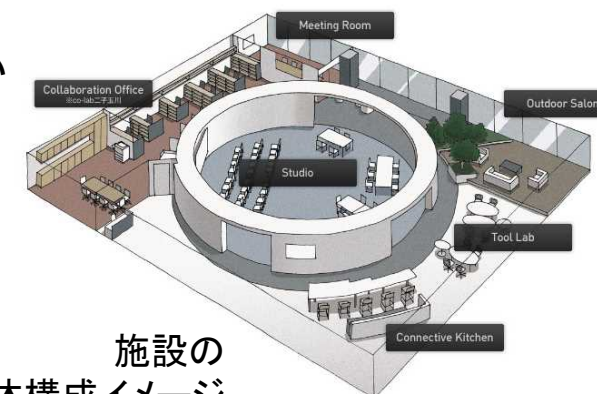
施設の 全体構成イメージ