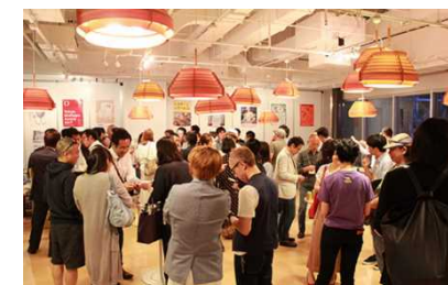
プレゼンテーションイベントの様子