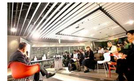
「ナレッジサロン」でのイベントの様子