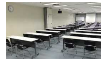
大阪商工会議所の会議室