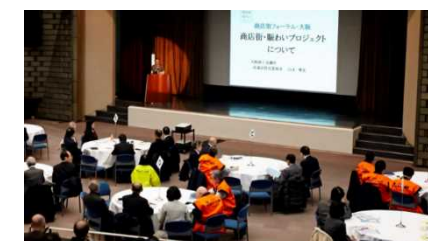
開催イベントの様子