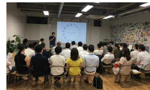
情報交換イベントの様子