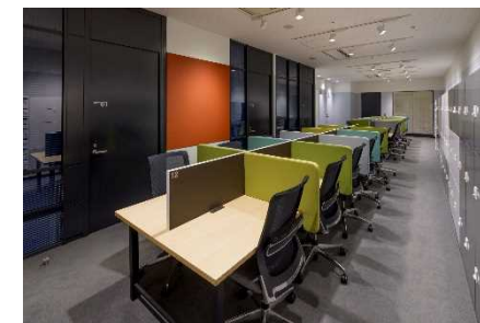
オフィススペース