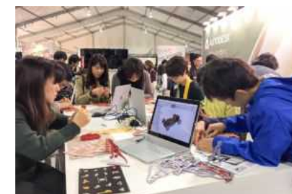
ワークショップの様子