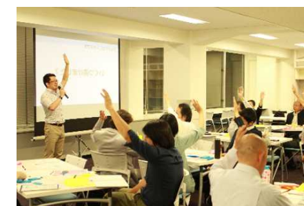
ワークショップの様子