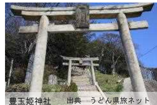
豊玉姫神社

島に残る豊玉姫伝説ゆかりの地として知られ、昔から安産の神様として護られてきました。石段を登りきると、そこから男木島の町並みと、綺麗な海が一望できます。