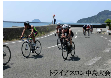
トライアスロン中島大会