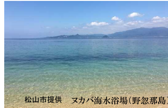
スカバ海水浴場(野忽那島)