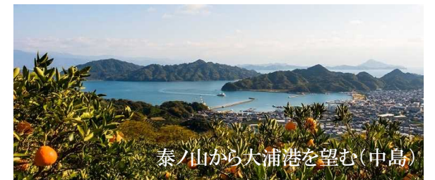
泰ノ山から大浦港を望む(中島)